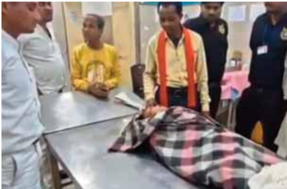
गया, जिससे उसकी मौके पर ही

जिले के नोहटा थाना क्षेत्र अंतर्गत कुलुआ पट्टी गांव में 5 वर्षीय मासूम की हत्या की घटना से सनसनी के हालात बने हुये है। घटना के बाद ग्रामीणों के सहयोग से पुलिस ने आरोपी युवक को हिरासत में लिए जाने की जानकारी सामने आ रही है। हालांकि अभी पुलिस की तरफ से अधिकारिक पुष्टी का इंतजार है। जानकारी के अनुसार, कुलुआ पट्टी गांव निवासी 5 वर्षीय बालक पर गांव के ही एक युवक द्वारा हमला किया