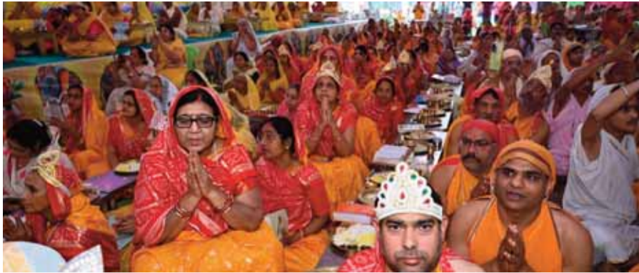
हरिभूमि न्यूज ▶▶ दमोह

सकल जैन समाज के द्वारा श्री नंदी मंदिर निर्माण कार्याथं श्री 24 समोशरण अरहंत चक्र महामंडल विधान का आयोजन उमा मिस्त्री की तलैया में चल रहा है। विधान के पांचवें दिन मुनि संघ के सानिध्य में 64 रिद्धि मंत्रों के अर्घ्य चढ़ाए गए।